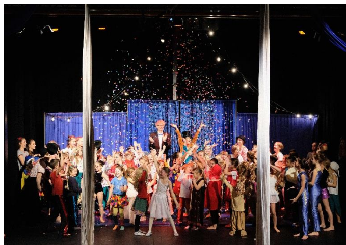
Gala Show: Finale!