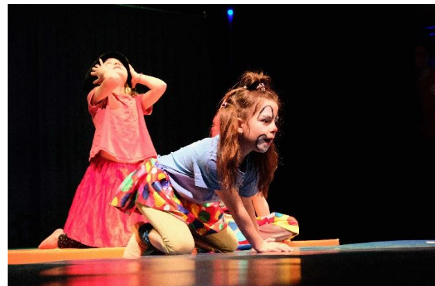
Gala Show: Clowns in Action

Nach einem halben Jahr intensivem Training und Proben, fand am 26. und 27. Januar 2018 die Galashow mit dem Motto "Zirkus" im Kirchgemeindehaus der Johanneskirche statt. Im Ganzen haben etwa 120 Kinder mitgewirkt, welche strahlend auf der Bühne standen und vor einem dreimal Ausverkauften Saal (rund 1000 Zuschauer im total!) ihr einstudiertes zum Besten gaben. So geordnet es auf der Bühne zu und her ging, so chaotischer war es hinter der Bühne. Backstage war einiges los: es wurde geschminkt, umgezogen, Spiele gespielt, herumgerannt, gelacht, gemalt und nervös gewartet, bis man endlich an der Reihe